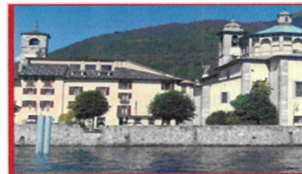
Hotel Il Portico Ortszentrum Cannobio an der romantischen Uferpromenade