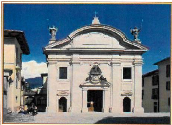
Wallfahrtskirche „SS Pietá“

Alle Zimmer sind komfortabel eingerichtet. Vor Ort wurde ein interessantes Ausflugs- und Besichtigungsprogramm zusammengestellt. Gute Voraussetzungen für eine tolle Fahrt.